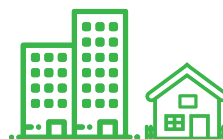
VIVIENDAS MULTI Y UNIFAMILIARES

El evento no contempla, las soluciones y tecnologías para los grandes parques de generación (solares, eólicos), grandes plantas de biomasa, hidroeléctricas, entre otras grandes instalaciones, por considerar que dichos proyectos tienen una dinámica propia relacionadas con licitaciones, actores y mercados específicos.