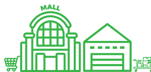
CENTROS COMERCIALES Y DE LOGÍSTICA